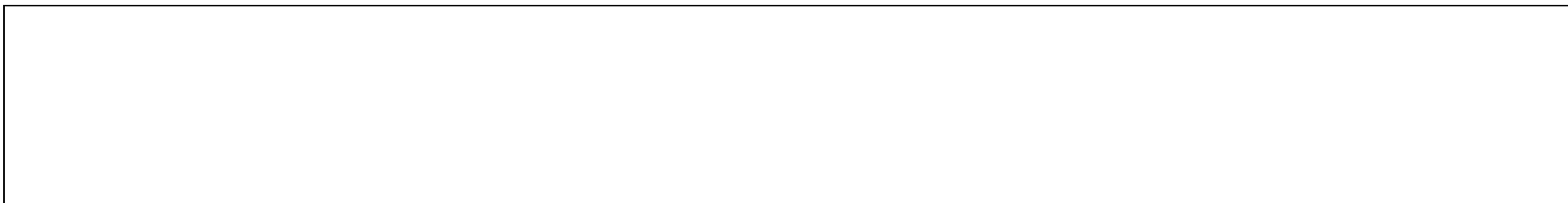
Схема разработана на топооснове М 1:500 (1:2000 по согласованию)

* Размер прилегающей территории определяется на основании положения глав и разделов Правил благоустройства территории муниципального образования