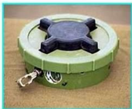
Рис.1 Общий вид мины ПМН-2