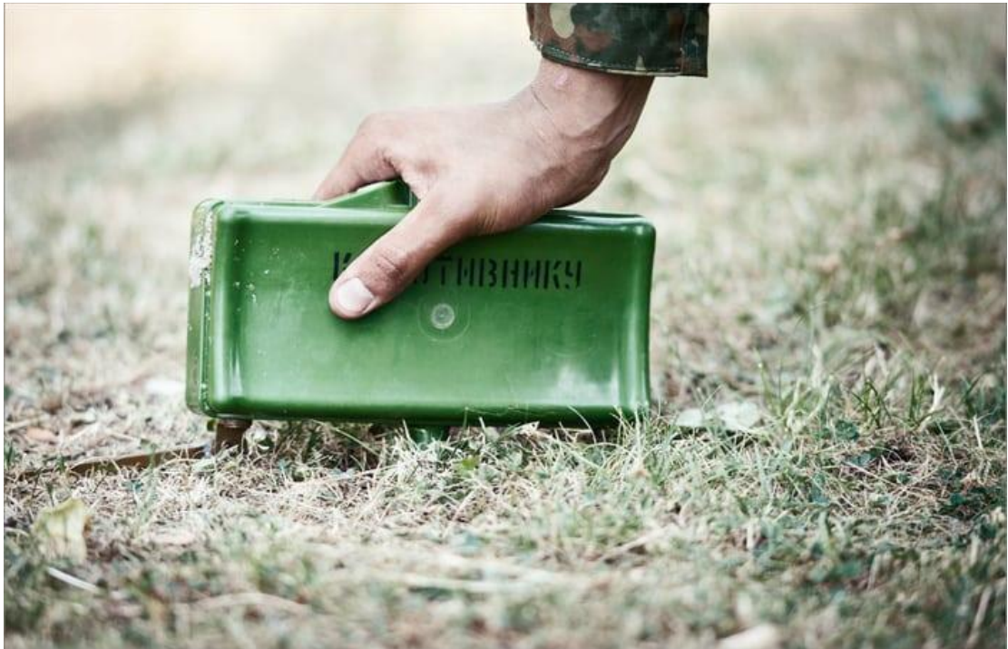
Мина в боевом положении